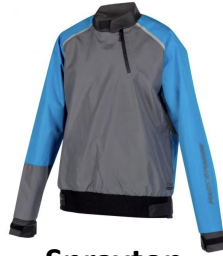
Spraytop ca. CHF 150.-