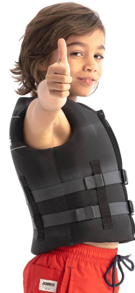
Schwimmweste ca. CHF 120.-