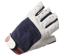
Segelhandschuhe ca. CHF 40.- (oder Landi-Gartenhandschuhe, CHF 6.-)