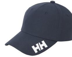
Cap / Sonnenschutz ca. CHF 25.-