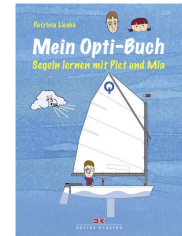
Opti-Buch ca. CHF 15.-