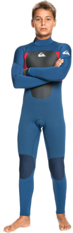
Neoprenanzug ca. CHF 200.-