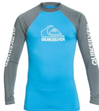
Lycra-Shirt ca. CHF 50.-