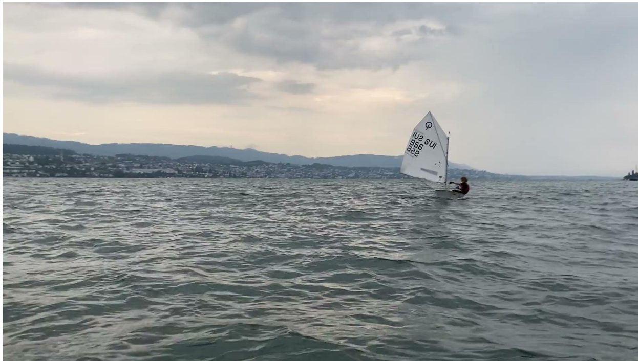
Noah auf Vorwindkurs