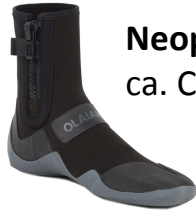
Neoprenschuhe ca. CHF 90.-