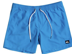
Bade-Shorts ca. CHF 25.-