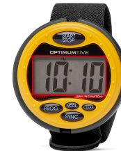
Regatta-Uhr ca. CHF 100.-